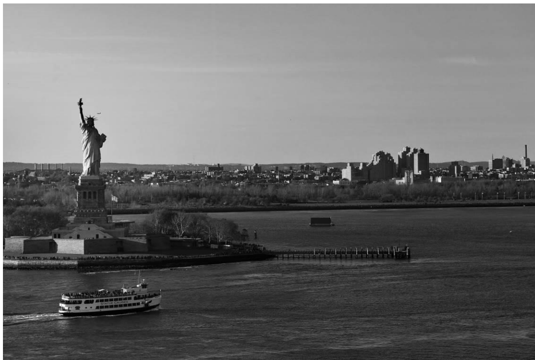
Liberty Island

Fotografický projekt je k dispozici také online na následujícím odkaze: https://new-york.czechcentres.cz/program/martinu-letni-vystava-online