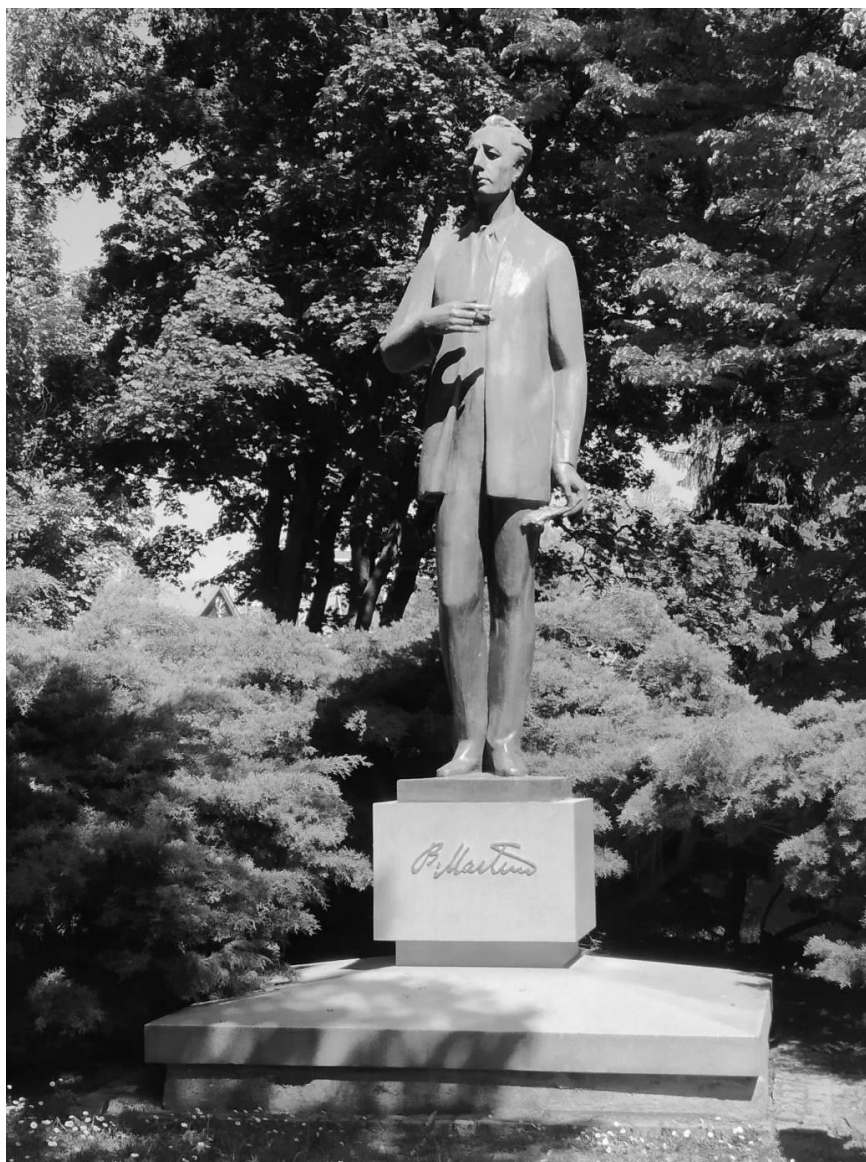
Milan Knobloch: Bohuslav Martinů

Město Polička se může chlubit hned několika jeho uměleckými díly. Nejznámější je socha B. Martinů v nadživotní velikosti, slavnostně odhalená roku 1990 u příležitosti 100 let od narození skladatele za přítomnosti tehdejšího prezidenta Václava Havla. Zajímavostí je, že při tvorbě sochy Knobloch konzultoval své pojetí se skladatelovým pamětníkem Jiřím Muchou. Po čase pro rozhlas vzpomenu, že ho Muchovy poznámky správně navedly: „Říkal, že musí být nenápadný, až stydlivý a to, myslím, že se mi v té soše podařilo.“