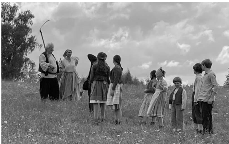
Z natáčení filmu Můj život s Bohuslavem Martinů

V prosinci si připomeneme výročí narození Bohuslava Martinů v Poličce a plánujeme uskutečnit zájezd na festival Dny Bohuslava Martinů do Prahy.