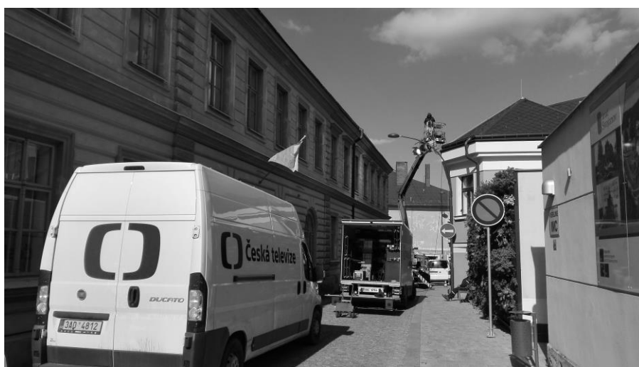
Z natáčení filmu Můj život s Bohusl. Martinů v Poličce