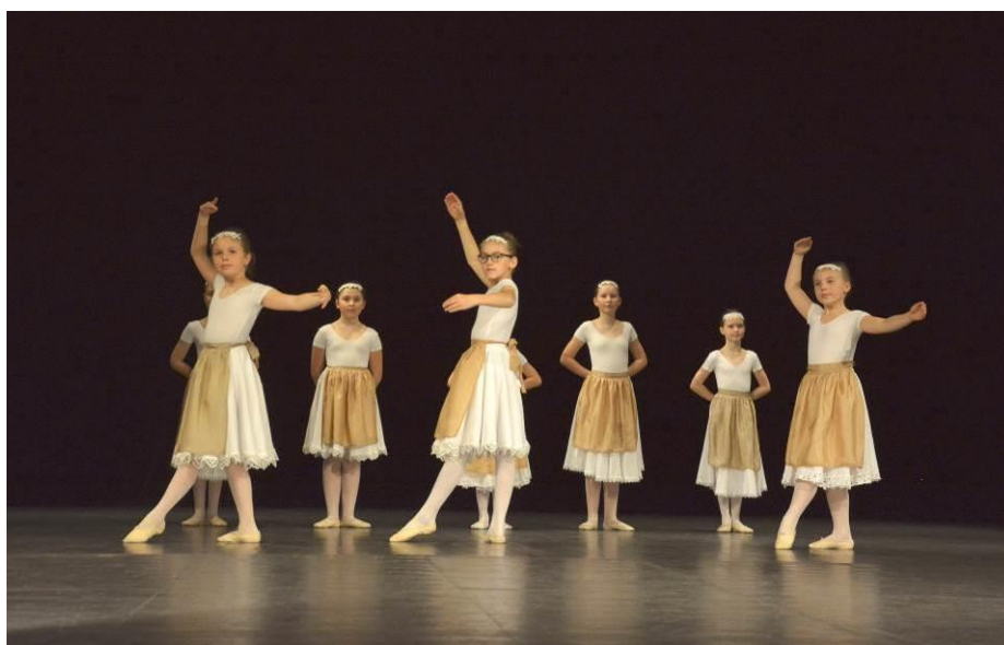
„Kuchyňská revue“ v podání žákyň tanečního oboru ZUŠ B. Martinů Polička

Soutěž je každoročně finančně podporována především Městem Polička, ale další podporu získává například z dotačních programů Pardubického kraje, či dotací Nadace Bohuslava Martinů a od dalších sponzorů. Některým ročníkům byla také udělena osobní záštita hejtmana Pardubického kraje či některých náměstků a nemalou podporou jsou mnohé podniky a firmy z poličského regionu.