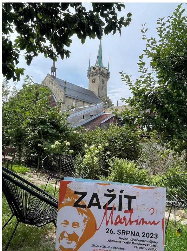
Občerstvení v kavárně

výročím úmrtí (65 let). Proto i v roce 2024 proběhne v Poličce připomínková akce Zažít Martinů , a to opět ve formě nikoliv smuteční, ale veselé a tvůrčí akce. A již nyní můžeme prozradit jeden z chystaných dramaturgických „bonbonků“, jímž bude provedení Martinů skladby Fantazie pro teremin, hoboj, klavír a smyčcový kvartet (H 301) z roku 1944, která nebývá pro své zcela nezvyklé nástrojové obsazení téměř vůbec hrána. Návštěvníci se mají na co těšit, protože bohaté aktivity budou rozloženy hned do dvou dnů, soboty a neděle 17. a 18. srpna 2024.