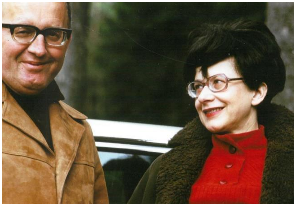
Viktor Kalabis a Zuzana Růžičková

cembala“ Zuzanou Růžičkovou. Manželé si zůstali věrni po celých 53 let až do Kalabisovy smrti dne 28. 9. 2006.