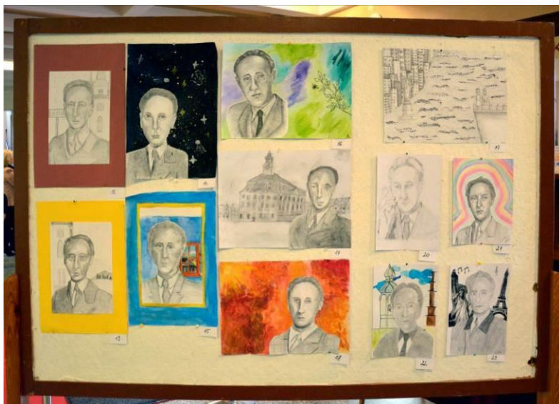
Ukázka prací z výtvarné soutěže

soutěže od roku 2019 a kromě hudebních se tedy střídá ob rok vždy taneční a výtvarný obor. Nutno připomenout, že kromě sólové intepretace, myslí soutěž také na kategorii komorní hry a komorního zpěvu, která se v rámci soutěže taktéž daří realizovat, byť interpretace sólová převažuje.