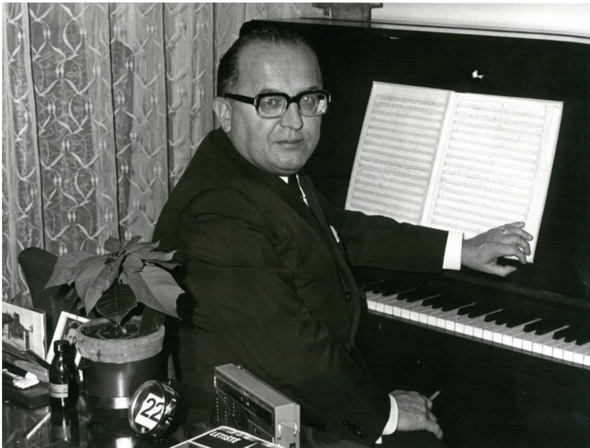
Viktor Kalabis (1923–2006) © Nadační fond V. Kalabise a Z. Růžičkové

https://www.nm.cz/ceske-muzeum-hudby/fletnove-obrazy-viktora-kalabise [13. 11. 2023]