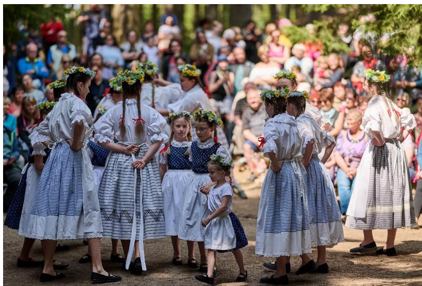
Otvírání Studánek v roce 2023

Každoročně je tato jarní slavnost příjemným a milým poslechem i pobavením ve Třech Studních.