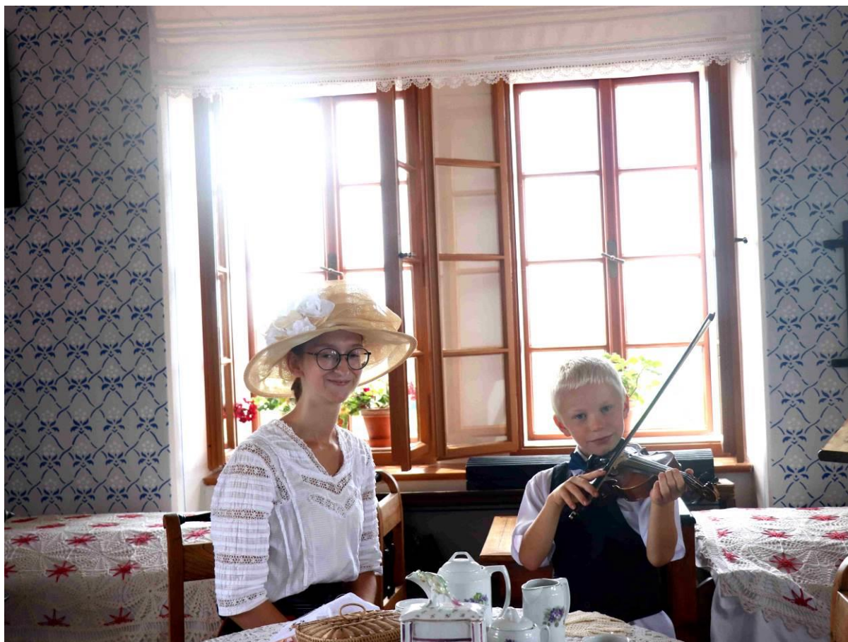
Kostýmované prohlídky

V odpoledních hodinách byly pro rodiče s dětmi připraveny dvě herny. První – taneční, nazvaná V rytmu Martinů , byla plná pohybu a tanečních kroků, neboť výrazné taneční jazzové rytmy byly jedním z nejtypičtějších znaků Martinů tvorby z doby jeho působení v Paříži. Druhá herna byla pojmenována Bajky a hádanky a zde byly děti formou hudebních úkolů zapojeny do vytváření nejrůznějších pohádkových příběhů. Do třetice pro děti bylo určeno odpolední vystoupení Hudba vážná nevážně – zprostředkovávající malým posluchačům zajímavosti hudby pro ně přístupnou formou.